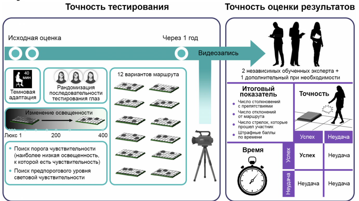
Рисунок 3. Процедура и оценка результатов MLMT